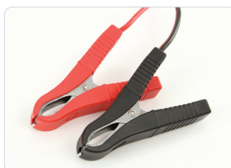
Hochwertige Polklemmen | High-quality pole terminals