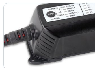
Ideal zum Befestigen an der Wand | Ideal to fix to the wall