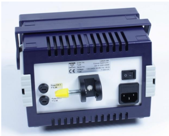
Abb. 2: Rückseite des Systemkleingehäuses mit Stativklemme

Keine Schrauben mit einer Länge von über 16 mm benutzen!